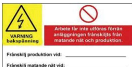
Figur 3: Exempel på skylt som varnar för bakspänning.